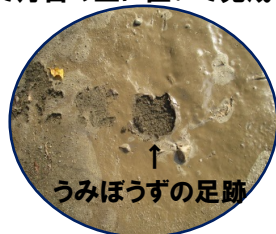
↑ うみぼうずの足跡

夕方に真珠灯台を見に行くと「うみぼうずの足跡があったよ！」「お昼寝している間に遊びに来たのかな」と大盛り上がり子どもたちでした。みんなが寝ている間に遊びに来るなんて、恥ずかしがり屋のうみぼうずさんだったようですね。