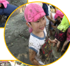
全身ドロドロになるまで楽しみまし