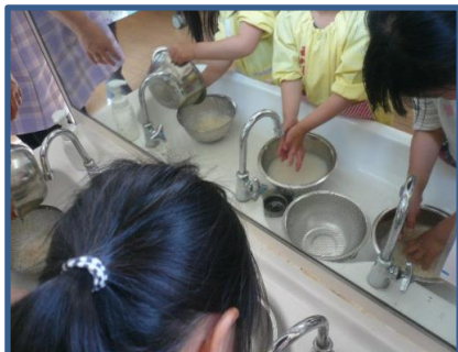
3回お水をこぼしてね～