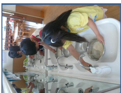
上手に研げてます