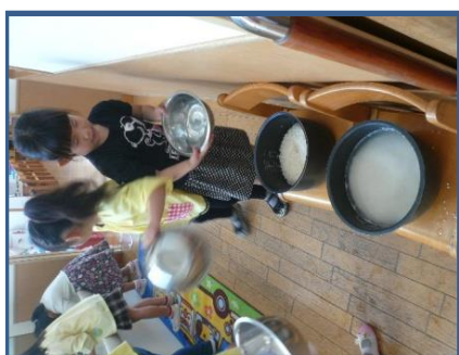
お水を「10」の目盛まで入れてね