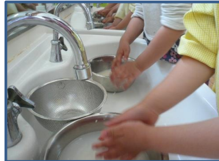
こぼさないように大切にね