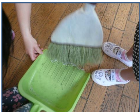
少しこぼれてしまったお米を みんなで掃きました。