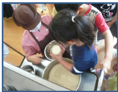
まずは一人2合ずつお米を量ります