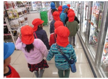
コンビニエンススト