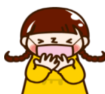
マスク着用、咳エチケット