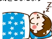
早寝・早起きしましょう