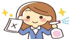
こまめな消毒も大切です