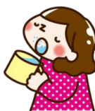
手洗い・うがいをしましょう