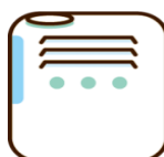
湿度を保ちましょう 目標湿度50%以上です