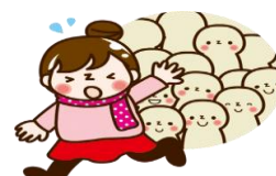
人込みを避けましょう