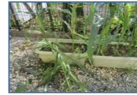
ある日の朝…ガーデン…荒らされて、食べられてる…