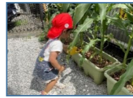
大きくなるのが楽しみ(^_^)