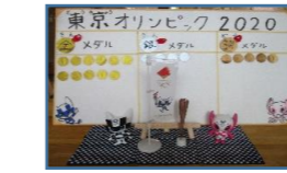
事務所前にオリンピックコーナーを設け、製作コーナーで応援グッズを作ったり、LaQでサッカーコートや五輪を作り興味関心が高まっています。