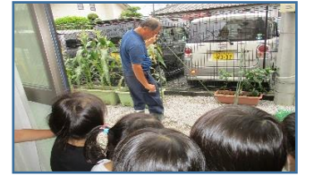
食べたのゴジラだよ。と大騒ぎ