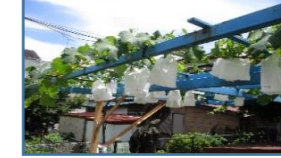
ブドウもこんなに大きくなりました。熟すのを待ちます