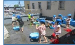
2階テラスで、グループごとに密にならないように遊んでいます