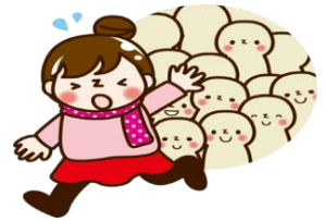
人込みを避けましょう