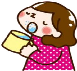
手洗いうがいをしましょう