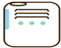
湿度を保ちましょう 目標湿度50%以上です