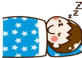
早寝・早起きしましょう