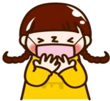
マスク着用、咳エチケット